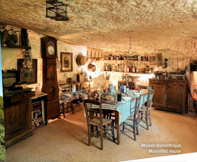
Maison monolithique Monolithic house

LA ROUTE DES CRÊCHES EN DÉCEMBRE ET PENDANT LES VACANCES DE NOËL La route des crèches du Périgord Noir. Dans l'un des abris troglodytiques du site, une crèche de Noël grandeur nature prend place au pied de la falaise.