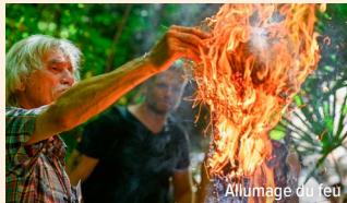
Allumage du feu

Notre animateur reproduit les gestes ancestraux de l'allumage du feu, à la manière de l'homme de Cro-Magnon et vous révèle le bouleversement qu'a représenté la maîtrise du feu pour nos ancêtres.