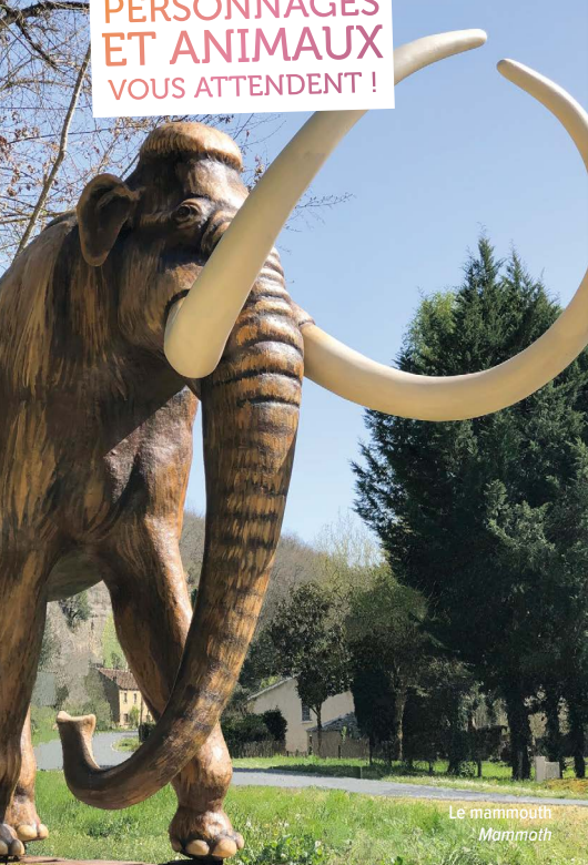
Le mammoth Mammoth

PLUS DE 100 PERSONNAGES ET ANIMAUX VOUS ATTENDENT !