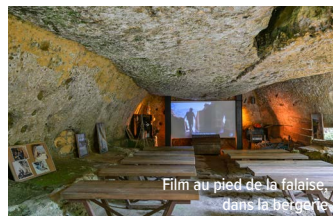
Film au pied de la falaise, dans la trépoine

UNE VIE SUSPENDUE AUX FALAISES DU PÉRIGORD : découvrez les coulisses de la préservation et de la mise en valeur de sites troglodytiques incontournables en Dordogne.