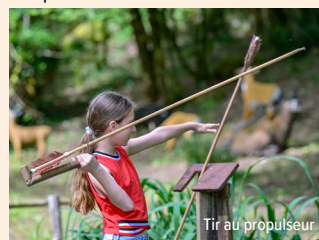
Tir au propulseur

VACANCES DE LA TOUSSAINT initiation tir au propulseur. Les mardis, mercredis et jeudis après-midi de 14h à 17h.