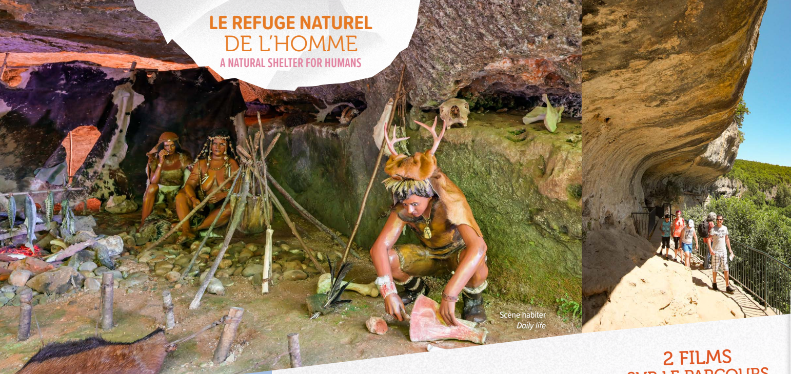
Scène habiter Daily life

PLUS DE 100 PERSONNAGES ET ANIMAUX VOUS ATTENDENT !