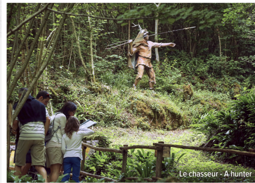
Le chasseur - A hunter

Depuis la Préhistoire, l'homme profite des bienfaits que lui offre la falaise pour y construire son habitat et s'y protéger.