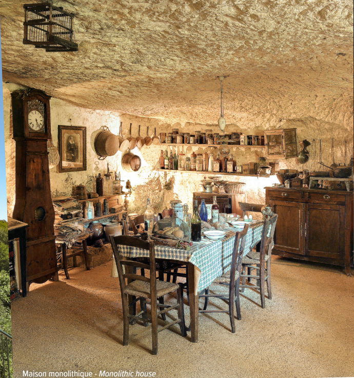
Maison monolithique - Monolithic house