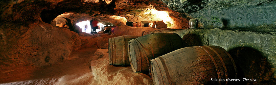
Salle des réserves - The cave