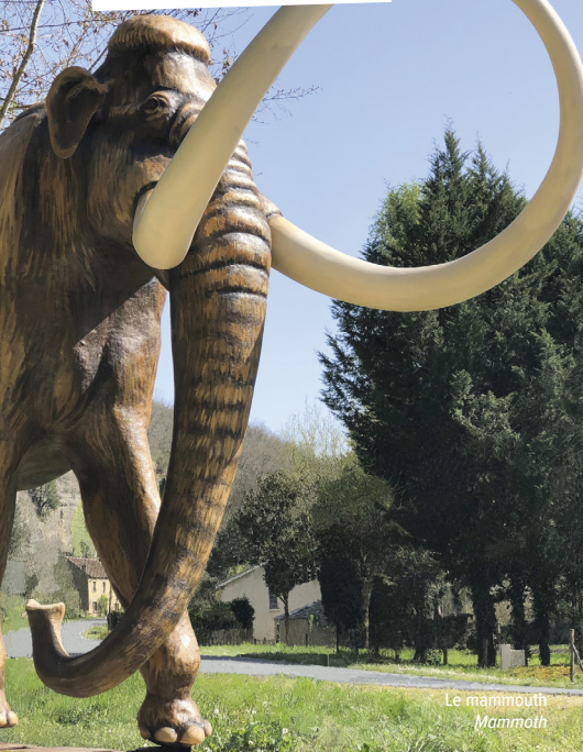
Le mammoth Mammoth

PLUS DE 100 PERSONNAGES ET ANIMAUX VOUS ATTENDENT !