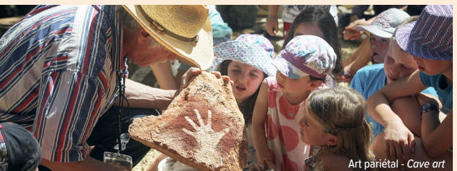
Art pariétal - Cave art

Inspirez-vous des peintures rupestres des cavités du Périgord et représentez une oeuvre de la Préhistoire en utilisant des ocres naturelles.